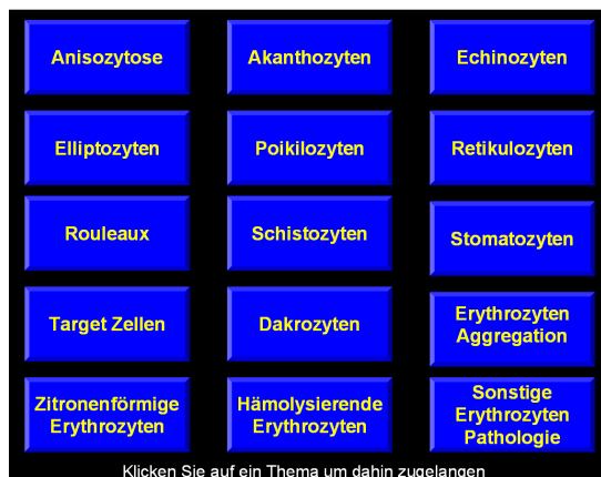
Untermenü Rote Blutkörperchen Submenu Red Blood Cells