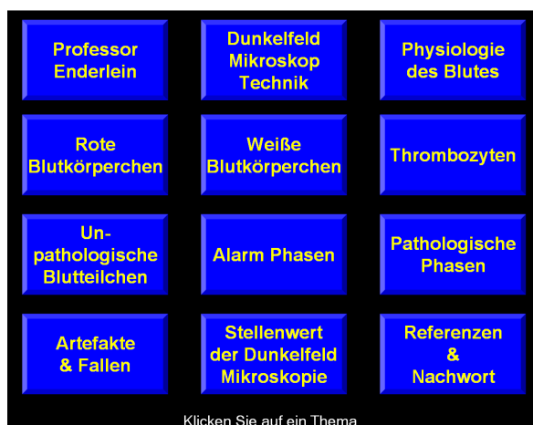
Hauptmenü – Main Menu